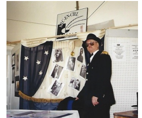
La Fête du citoyen au Parc régional de Longueuil sous le thème Hollywood Boulevard

L'Halloween est, encore cette année, l'occasion de fêter et aussi de se costumer... pour le plaisir!