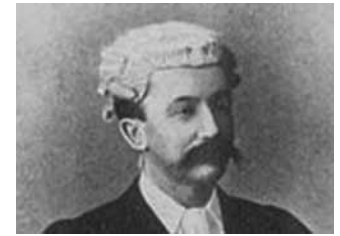
Frederic Edward Weatherly